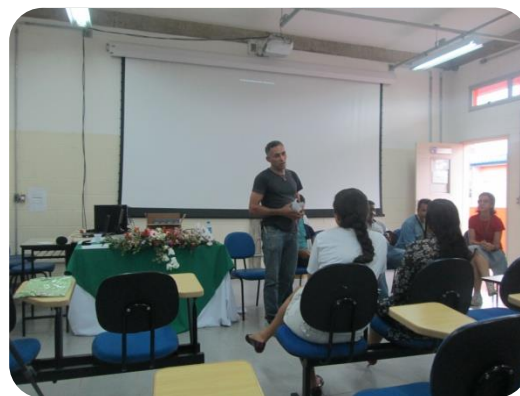
Membros das comunidades quilombolas do Vale do Ribeira contando um pouco da sua história e luta pela resistência.