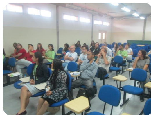
Participantes atentos ao tema.