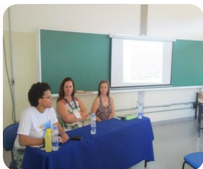
Palestrantes discorrem sobre o tema

Esta ação permitiu reflexões sobre a necessidade de o Câmpus promover o desenvolvimento de atitudes de tolerância e respeito à diversidade que está relacionado com o direito à educação, à igualdade de oportunidades e à participação na sociedade.