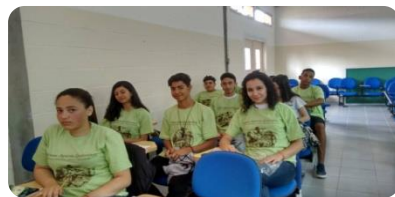
Todos os participantes foram premiados com uma linda camiseta que retrata a luta quilombola e o sistema agrícola.