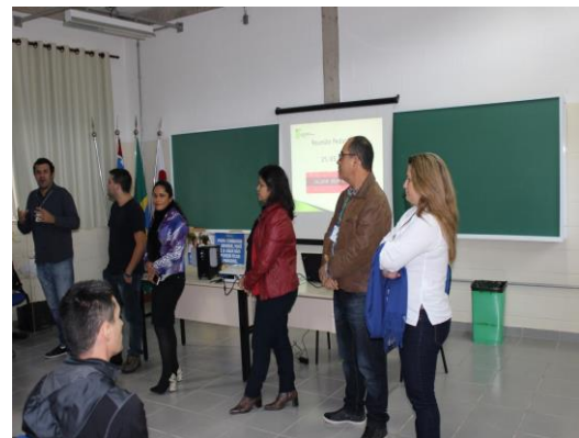
Equipe de Formação Continuada do Câmpus Registro se apresentando, cada membro falando das suas expectativas e objetivos para atuação nesta comissão.