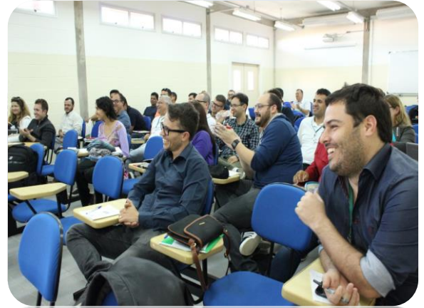
Professores atentos às atividades.