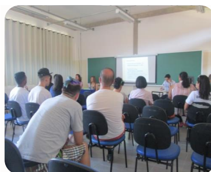
Participantes atentos às discussões